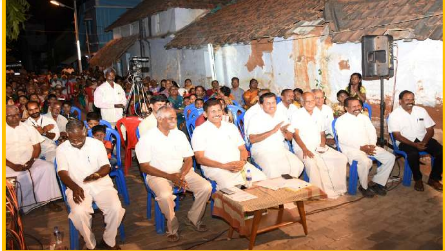
மேலும் மண்டல மற்றும் அறக்கட்டளை நிர்வாகிகள், முக்கிய பிரமுகர்கள், பேராசிரியர்கள், பொதுமக்கள், கிராம பொதுமக்கள் ஆகியோர் கலந்து கொண்டு சிறப்பித்தார்கள்.