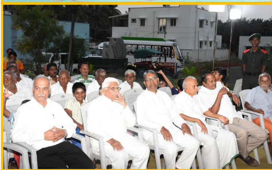
மேலும் ஆழியார் அறிவுத்திருக்கோயில் அறங்காவலர்கள், முக்கிய பிரமுகர்கள், பேராசிரியர்கள், பொதுமக்கள், அறக்கட்டளை நிர்வாகிகள், கிராம பொதுமக்கள் ஆகியோர் கலந்து கொண்டு சிறப்பித்தார்கள்.