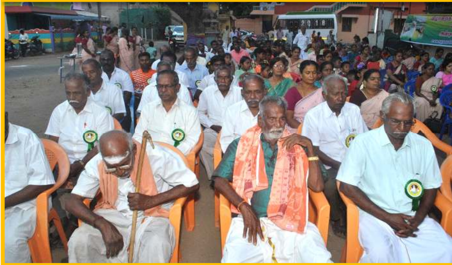
மேலும் முக்கிய பிரமுகர்கள், பேராசிரியர்கள், பொதுமக்கள், மண்டல மற்றும் அறக்கட்டளை நிர்வாகிகள், கிராம பொதுமக்கள் ஆகியோர் கலந்து கொண்டு சிறப்பித்தார்கள்.