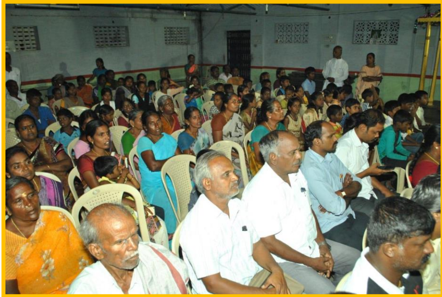
மேலும் முக்கிய பிரமுகர்கள், பேராசிரியர்கள், பொதுமக்கள், மண்டல மற்றும் அறக்கட்டளை நிர்வாகிகள், கிராம பொதுமக்கள் ஆகியோர் கலந்து கொண்டு சிறப்பித்தார்கள்.