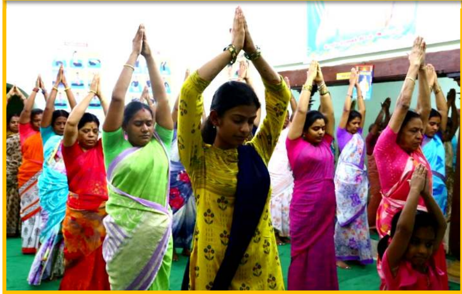
பயிற்சி பெற்றோர் விவரங்கள்