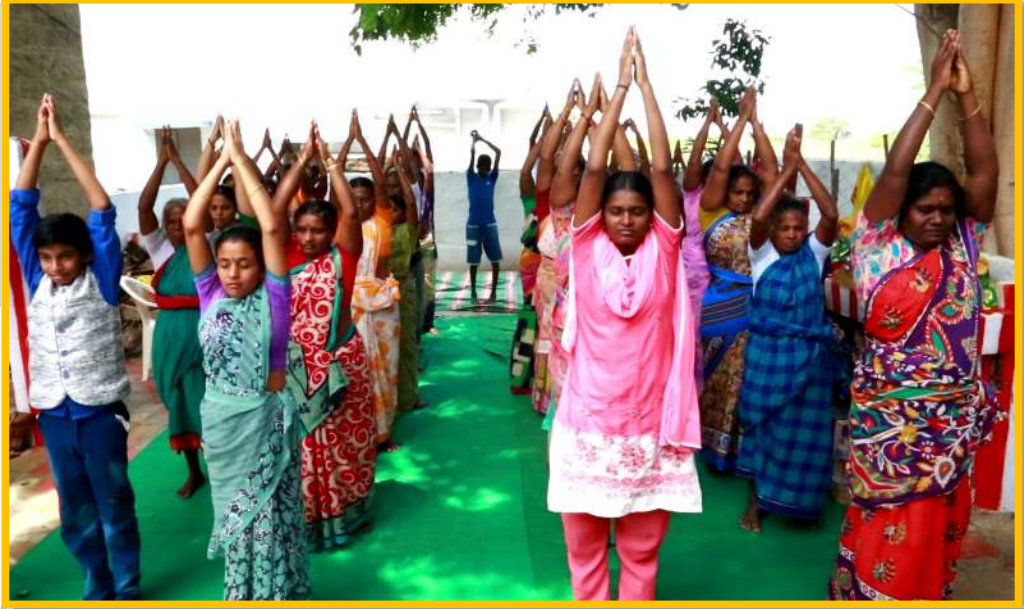
பயிற்சி பெற்றோர் விவரங்கள்